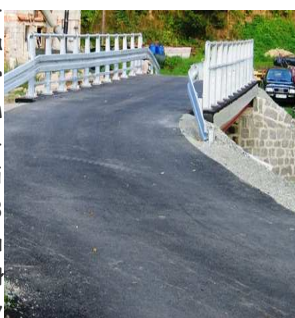
DROGA W STRATYM GIERAŁTOWIE

W celu poprawy komunikacji w obrębie Starego Gierałtowa została zmodernizowana droga gminna nr 26 i 28 o długość niespełna 0,5 km oraz wyremontowany most na Białej Łądeckiej. Koszt remontu drogi wyniósł ok. 220 tys. zł, z czego 103 tys. to dofinansowanie z Budżetu Państwa. Remontu mostu wyniósł ok. 190 tys. zł i został sfinansowany ze środków Gminy, Budżetu Państwa oraz Funduszu Ochrony Gruntów Rolnych.