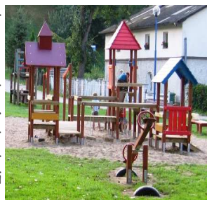
PLAC ZABAW — STRONIE ŚLĄSKIE

W Stroniu Śląskim został zmodernizowany plac zabaw dla dzieci. Nowy plac zabaw został wyposażony w „Zestaw Kubuś”, bujaki sprężynowe, huśtawki nóżki i huśtawki wyposażone w siedliska dla dzieci.