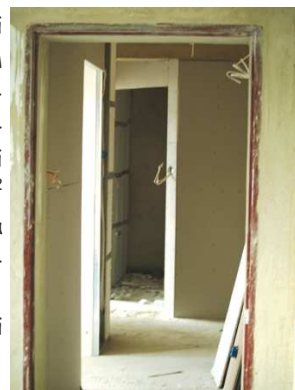
BUDYNEK PRZY UL. ZIELONEJ 5

Przewidywany koszt inwestycji szacowany jest na ok. 1,2 mln zł.