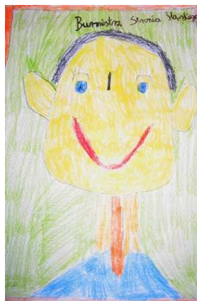
III nagroda Mateusz Kukin