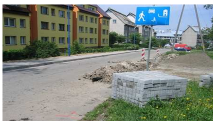
STRONIE ŚLĄSKIE UL. 40-LECIA PRL

Od 01 czerwca w ramach programu „Moje boisko Orlik 2012” zostanie zatrudniony animator prowadzący zajęcia sportowo – rekreacyjne dla dzieci i młodzieży z Gminy Stronie Śląskie. Plan zajęć oraz godziny otwarcia boisk zostaną podane do publicznej wiadomości w terminie późniejszym.