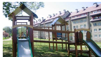
STRONIE ŚLĄSKIE MIEJSKI PLAC REKREACJI