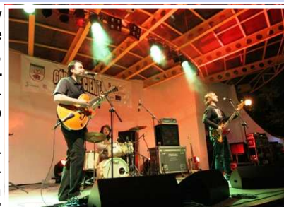
Zespół „-123min.” z Republiki Czeskiej

W dniach 1-2 maja 2009 w Stroniu Śląskim miała miejsce impreza „Górskie Cienie”, Przegląd Lokalnych Twórców . Organizatorem tego dwudniowego przedsięwzięcia było Stowarzyszenie Stacja Stronie, dla którego był to „chrzest bojowy” w samodzielnej organizacji tak dużych wydarzeń publicznych. „Górskie Cienie” finansowane były przez Program Operacyjny Kapitał Ludzki ze środków Europejskiego Funduszu Społecznego, a także ze środków Gminy Stronie Śląskie.