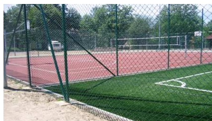
STRONIE ŚLĄSKIE „ORLIK 2012”